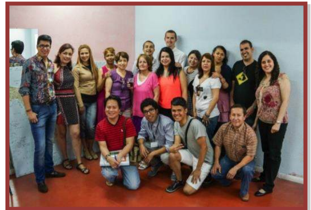
Grupo 4. CEPI Hispano Dominicano, del 3 al 14 de Junio.