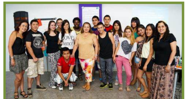
Grupo 5. Centro Juvenil de Chamberí y Tetuán Punto Joven del 8 al 19 de Julio.