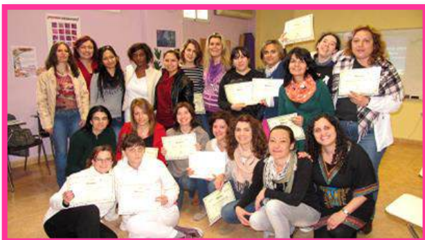
Grupo 2. Espacio de Igualdad Dulce Chacón de Villaverde, del 24 de Abril al 28 de Mayo.