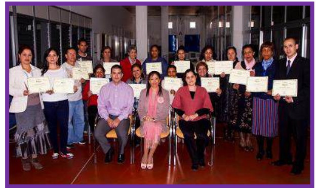
Grupo 3. Asociación amigos MIRA, del 6 al 17 de Mayo.

✓ Se realizaron 38 sesiones formativas a lo largo del proyecto, a través de las cuales se trataron diferentes temas, que repercutieron de forma muy positiva en su bienestar integral.