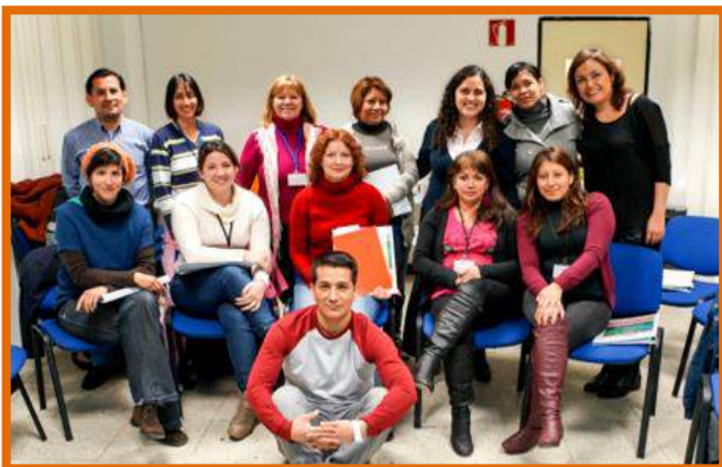
Grupo 1. CEPI Hispano Ecuatoriano de Tetuán, del 9 al 30 de Abril.